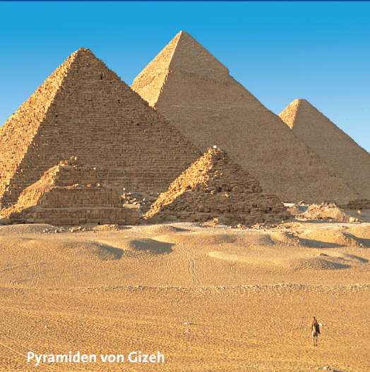
Pyramiden von Gizeh

1 Woche Kreuzfahrt im Roten Meer inklusive Flug bereits ab € 599,-