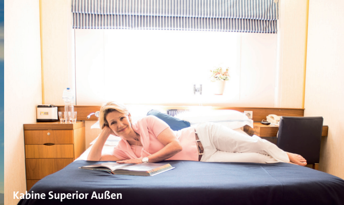
Kabine Superior Außen