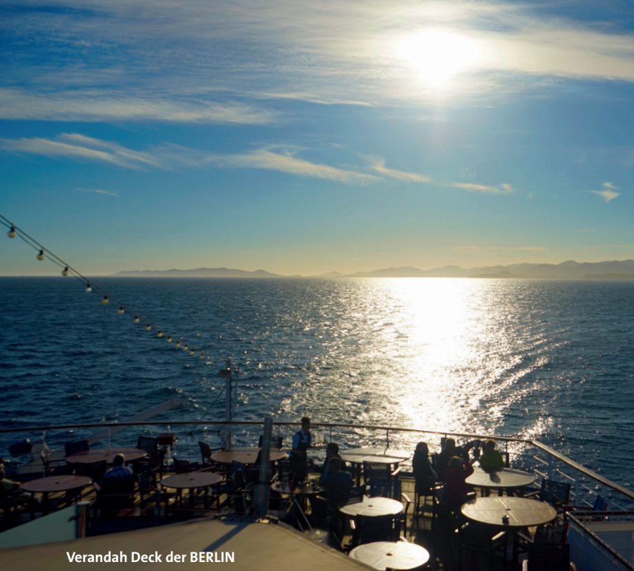
Verandah Deck der BERLIN